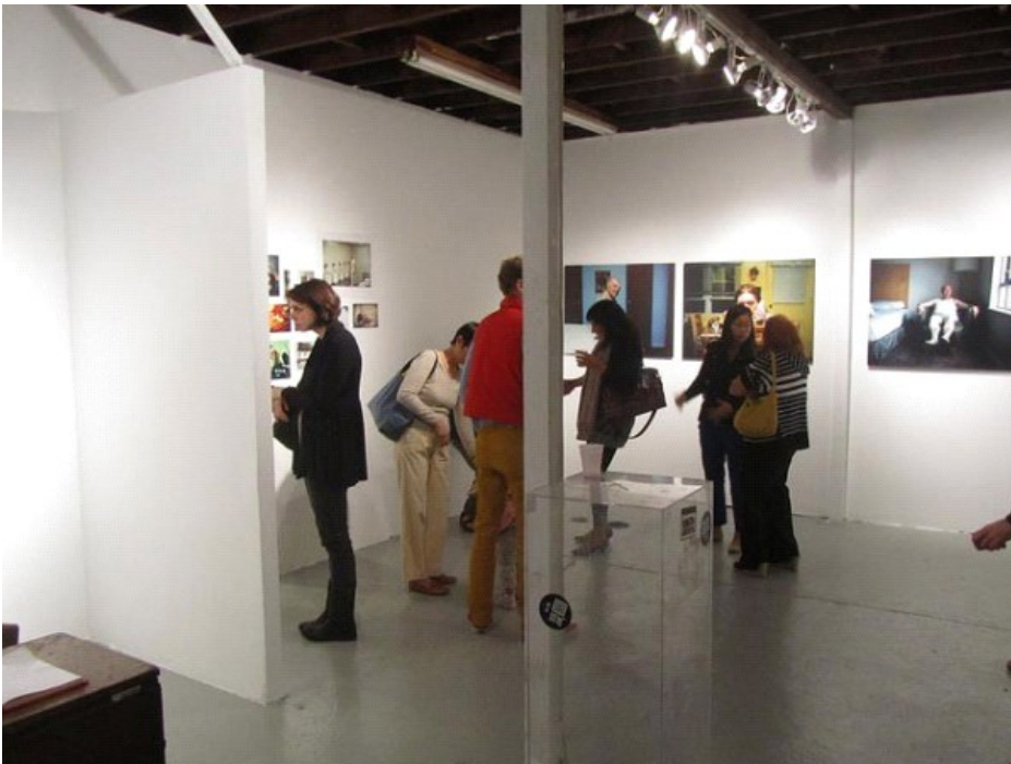
Local Project, Nueva York

Fundado en el 2003 por un grupo de amigos con la idea de abrir una galería accesible a todo mundo y que no se pareciera en nada a los sofisticados espacios de Chelsea, Local Project se ha caracterizado por la diversidad de su convocatoria, agrupando a artistas estadounidenses, europeos y latinoamericanos y conformando un público muy plural integrado por artistas jóvenes y, en general, personas interesadas en el arte.