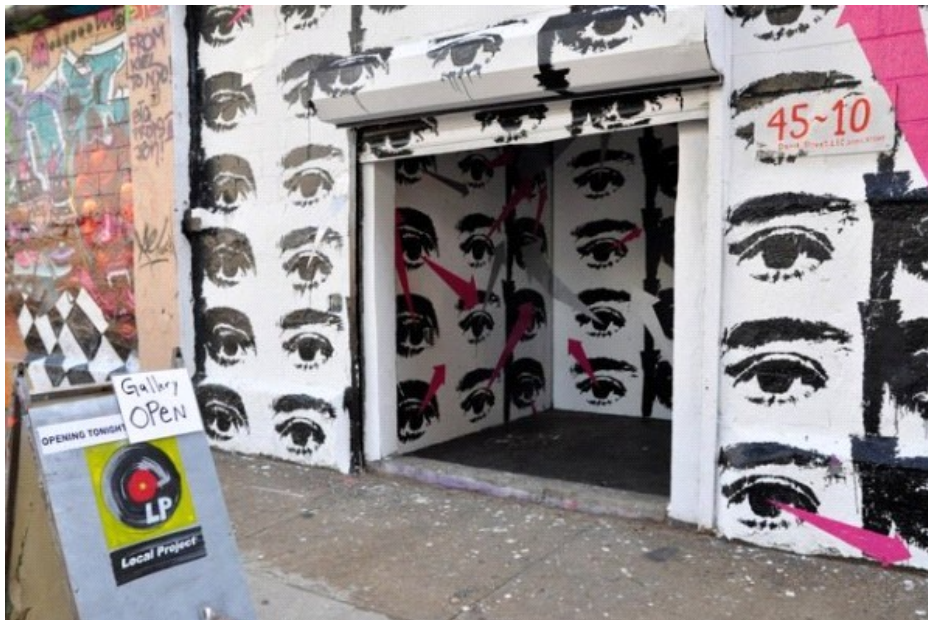
Fachada de Local Project, Long Island City, Nueva York

A pocos pasos del PS1/MoMA, en Long Island City, Nueva York, y cerca de los famosos graffitis de 5 Pointz, se ubica Local Project, un espacio de arte alternativo que desde hace nueve años promueve a artistas de todas partes del mundo, y que a partir de este 16 de diciembre tendrá una sede en Santiago, en el Condominio Condarco Loft , como parte de una iniciativa inmobiliaria de recuperación patrimonial en el barrio de Providencia.