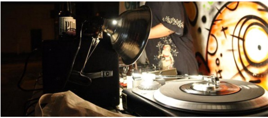
Local Project, Nueva York